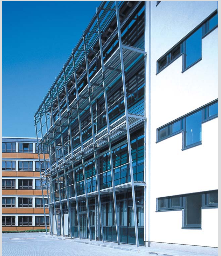
▲ Die Fassade als Gebäudehülle